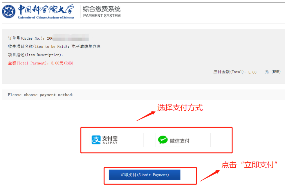
图 8 支付界面