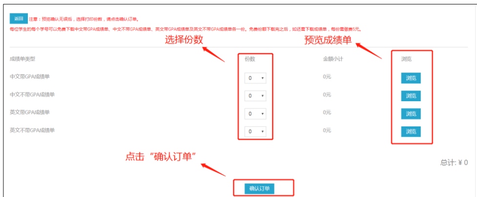
图 7 确认订单界面