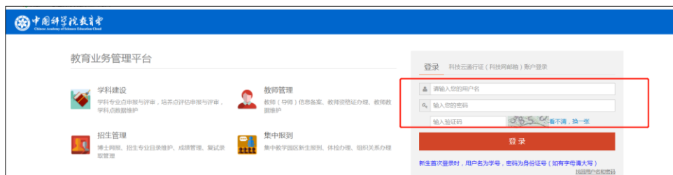
图1 网页登录 SEP 平台界面

方式二：关注“中国科学院大学”微信企业号后登陆“选课系统”（微信企业号关注流程见图2）。路径：“中国科学院大学”微信企业号—“网上办事大厅”—“教务部电子成绩单申请”—进入SEP系统—“选课系统”（见图3）。