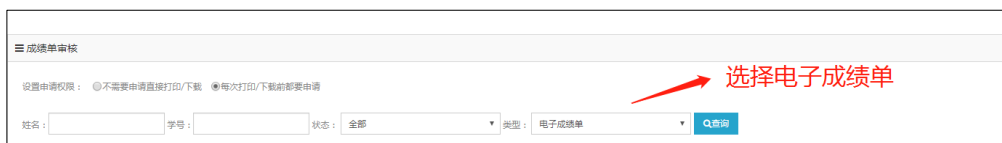
图 5 审批界面