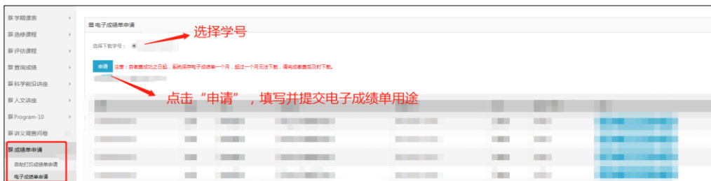
图 4 申请界面